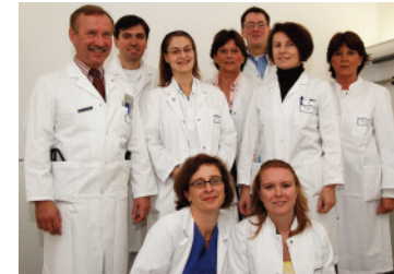
Das Team der Diabetes-Station

Zur Medizinischen Klinik II gehört eine von der Deutschen Diabetes-Gesellschaft (DDG) anerkannte Schulungs- und Therapiestation für Menschen mit Diabetes mellitus.