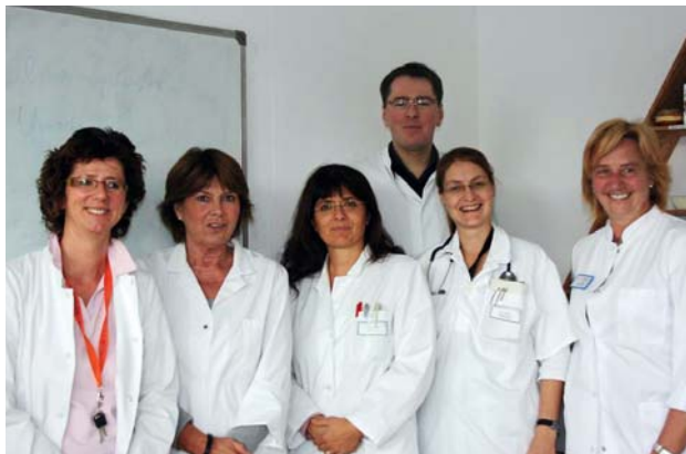
Das Diabetes-Team der Medizinischen Klinik II