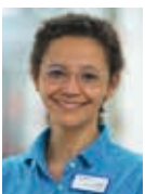
Carmen Enters Palliative Care Fachkraft